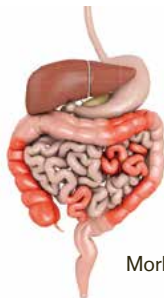
Morbo di Crohn

Nonostante un'intensa attività di ricerca, le cause scatenanti di questa reazione sono ancora ignote. Esistono terapie sempre più efficaci, ma ad oggi, non vi è possibilità di guarigione. Sono disponibili una serie di farmaci e aiuti forniti dalla medicina complementare che, soprattutto, reprimono l'infiammazione e impediscono che si sviluppino complicazioni. Nei casi gravi si possono prendere in considerazione anche interventi chirurgici. Le malattie infiammatorie croniche intestinali più frequenti sono il morbo di Crohn e la colite ulcerosa.